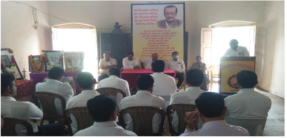
‘महात्मा गांधी जयंती’ कार्यक्रमाचे आयोजन