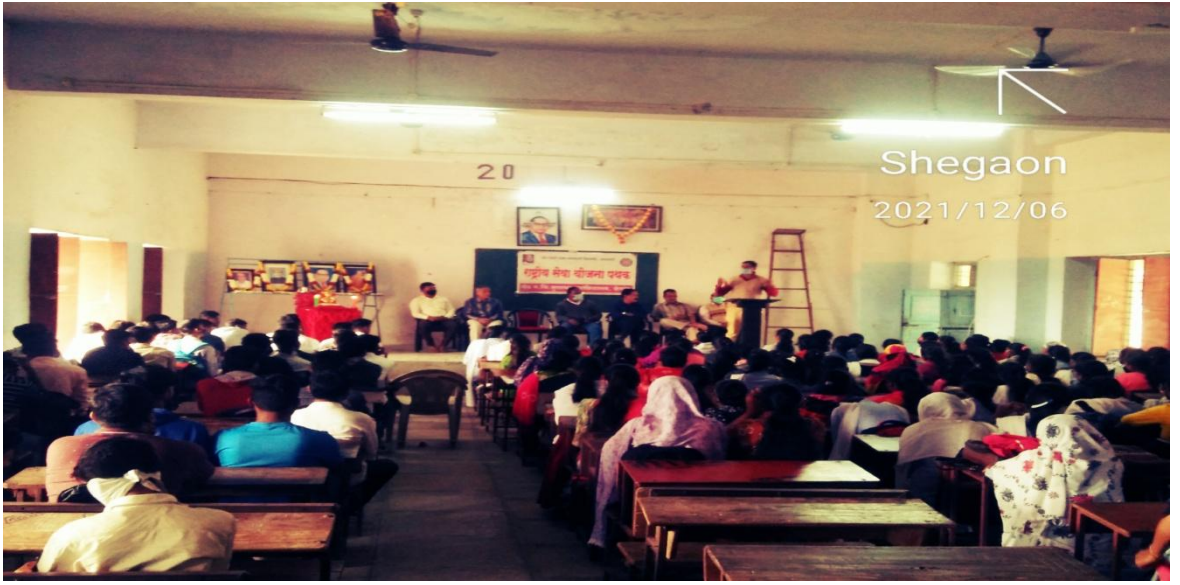
MkW- ckcklkgsc vkacsMdj egkifjfuokZu fnu 6-12-2021