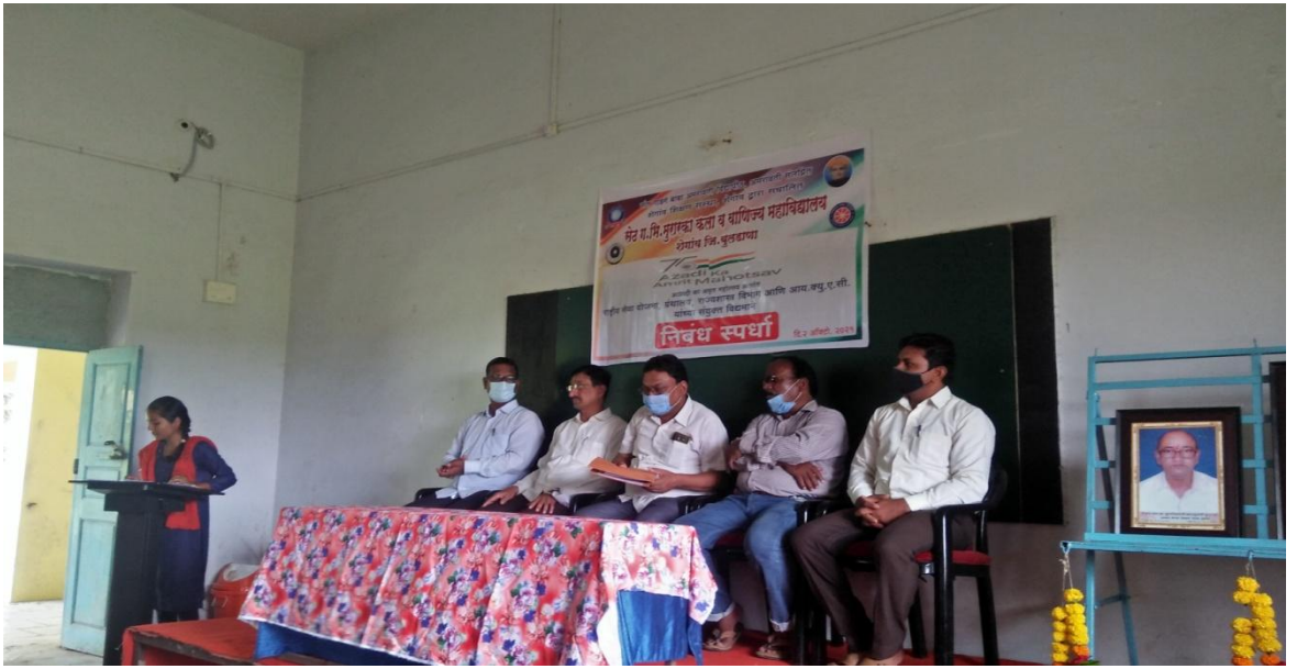
महाविद्यालयात “निबंध स्पर्धा” चे आयोजन.