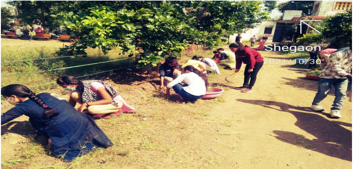
महाविद्यालय परीसरात रासेयोच्या वतीने वृक्षलागवड दि. 30.10.21