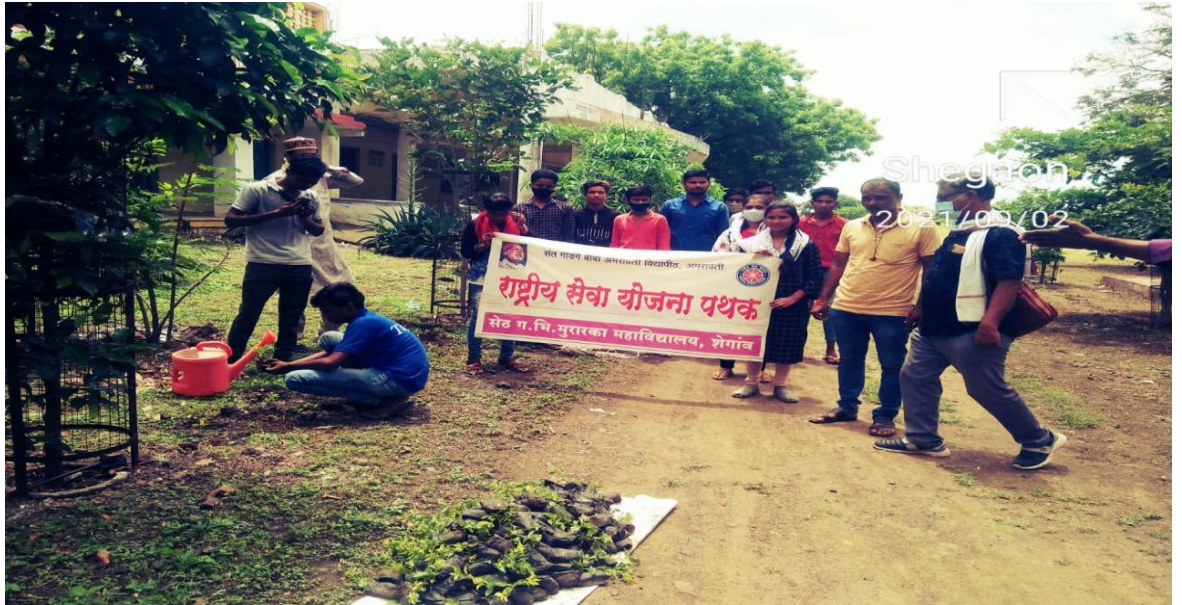
महाविद्यालयीन परीसरत वृक्षलागवड कार्यक्रम