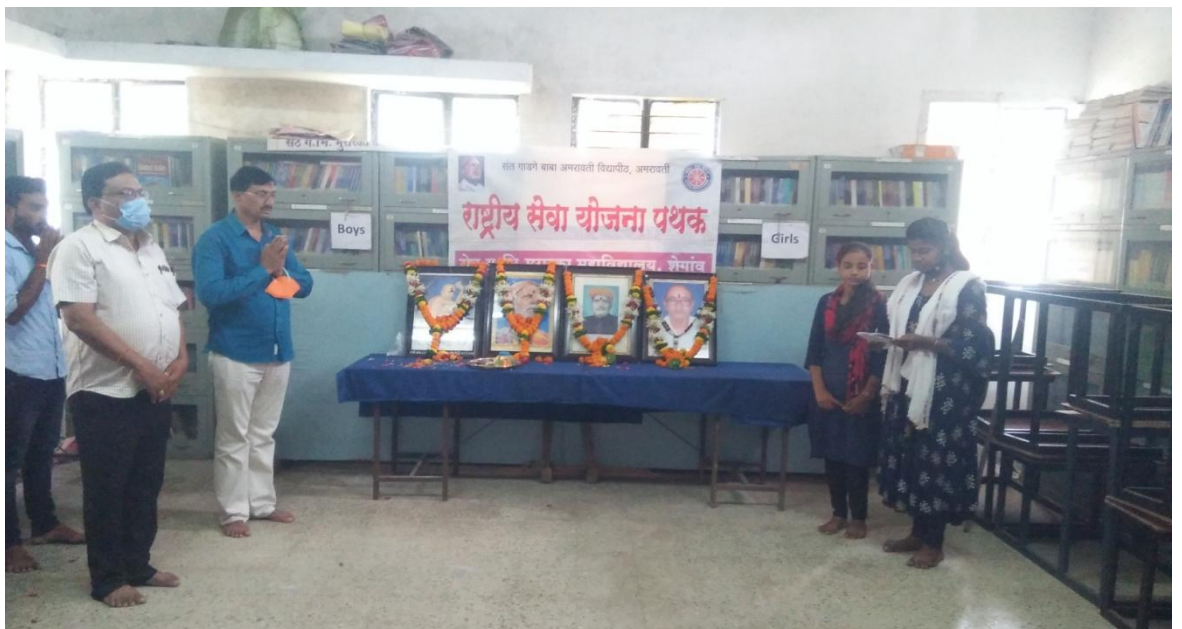
राष्ट्रीय सेवा योजना दिवस साजरा