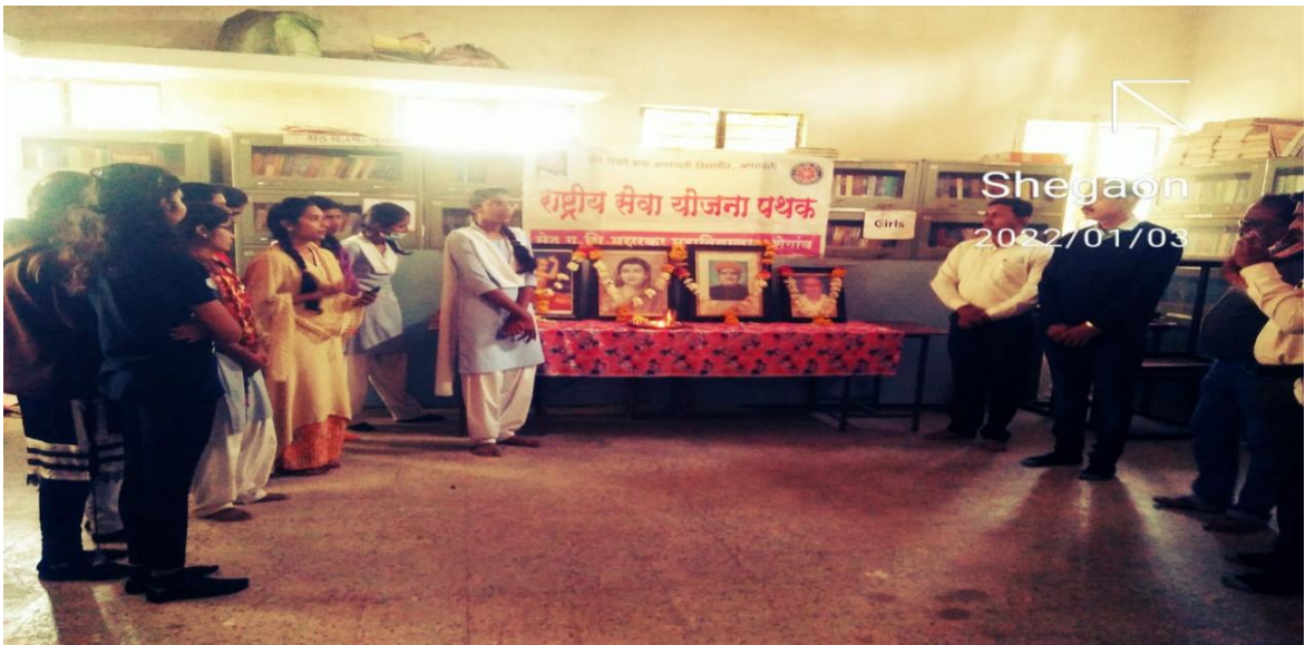
क्रांतीज्योती सावित्रीबाई फुले जयंती 3 जानेवारी 2022