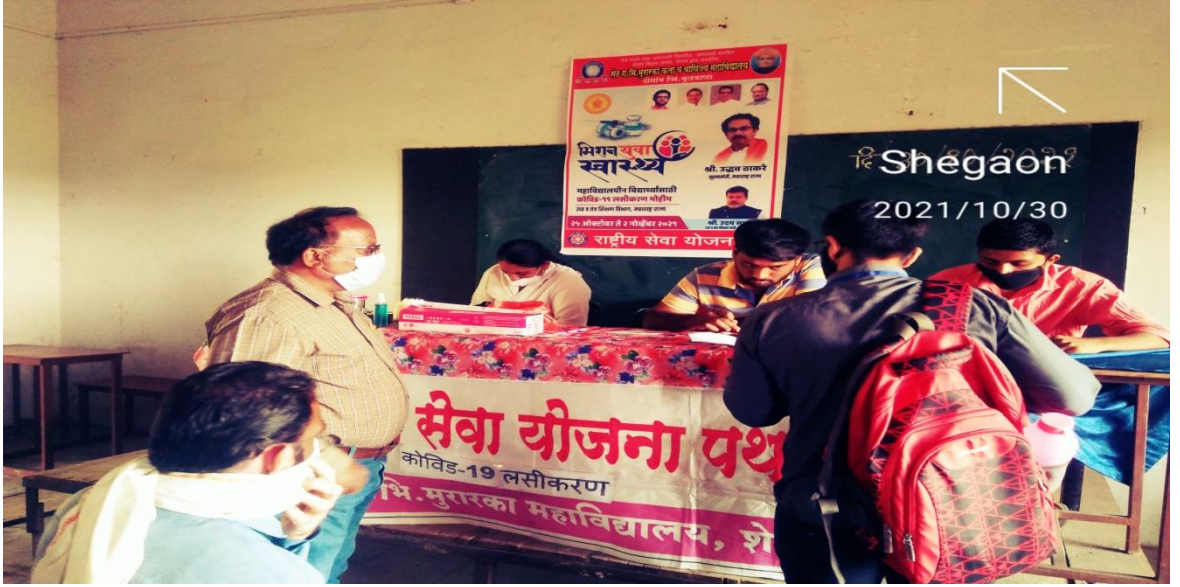
कोविड-19 लसीकरण कार्यक्रम (तिसरा लसीकरण कॅम्प)