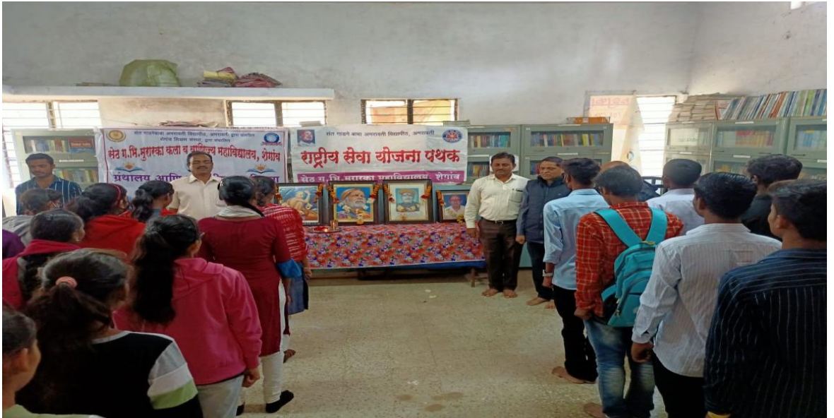
संत गाडगे बाबा पुण्यतिथी दि. 20.12.2021