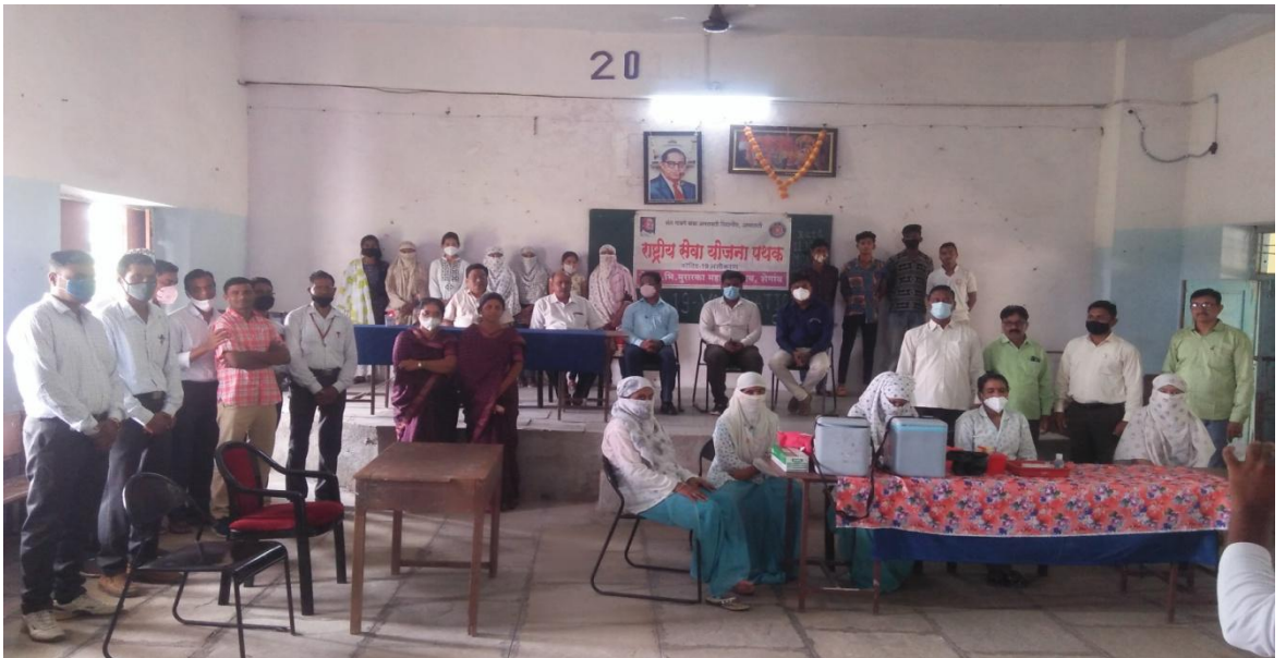
कोविड-19 लसीकरण कार्यक्रम (पहिला लसीकरण कॅम्प)