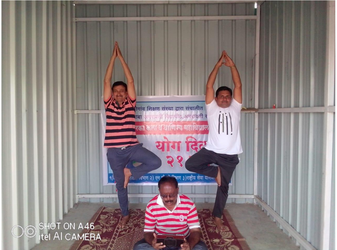
21 जून 2021 ऑनलाईन योग दिन