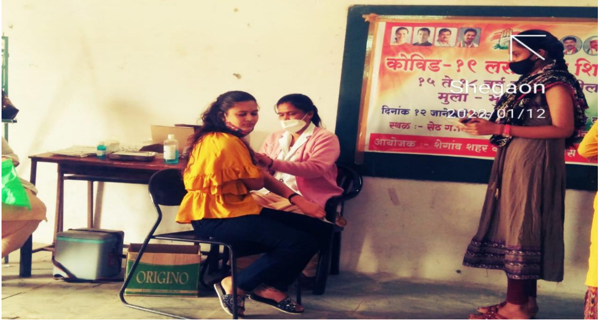
राष्ट्रीय युवा दिन व कोविड 19 लसीकरण शिबीर 12 जानेवारी 2022