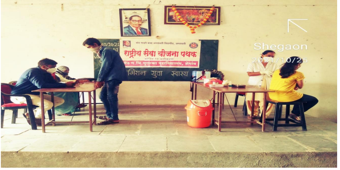
कोविड-19 लसीकरण कार्यक्रम (दुसरा लसीकरण कॅम्प)